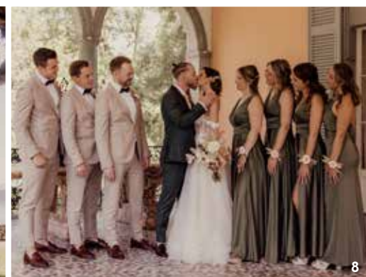
7 TRAUUNG Zeremonie mit Seesicht. 8 FIRSTLOOK Die Bridesmaids und Groomsmen mit dem Brautpaar. 9 ÜBERRASCHUNG Fotoshooting auf dem Motorboot.